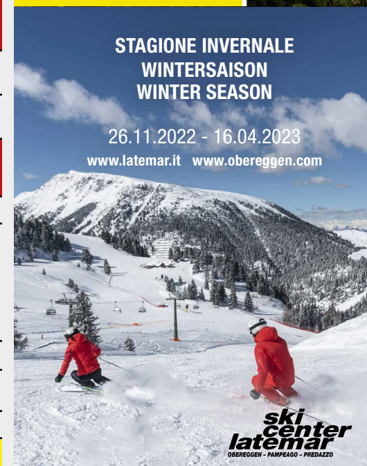
STAGIONE INVERNALE WINTERSAISON WINTER SEASON 26.11.2022 - 16.04.2023 www.latemar.it www.obereggen.com