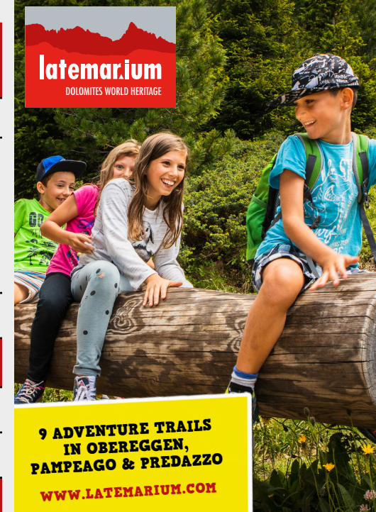
9 ADVENTURE TRAILS IN OBERECCEN, PAMPEAGO & PREDAZZO WWW.LATEMARIUM.COM