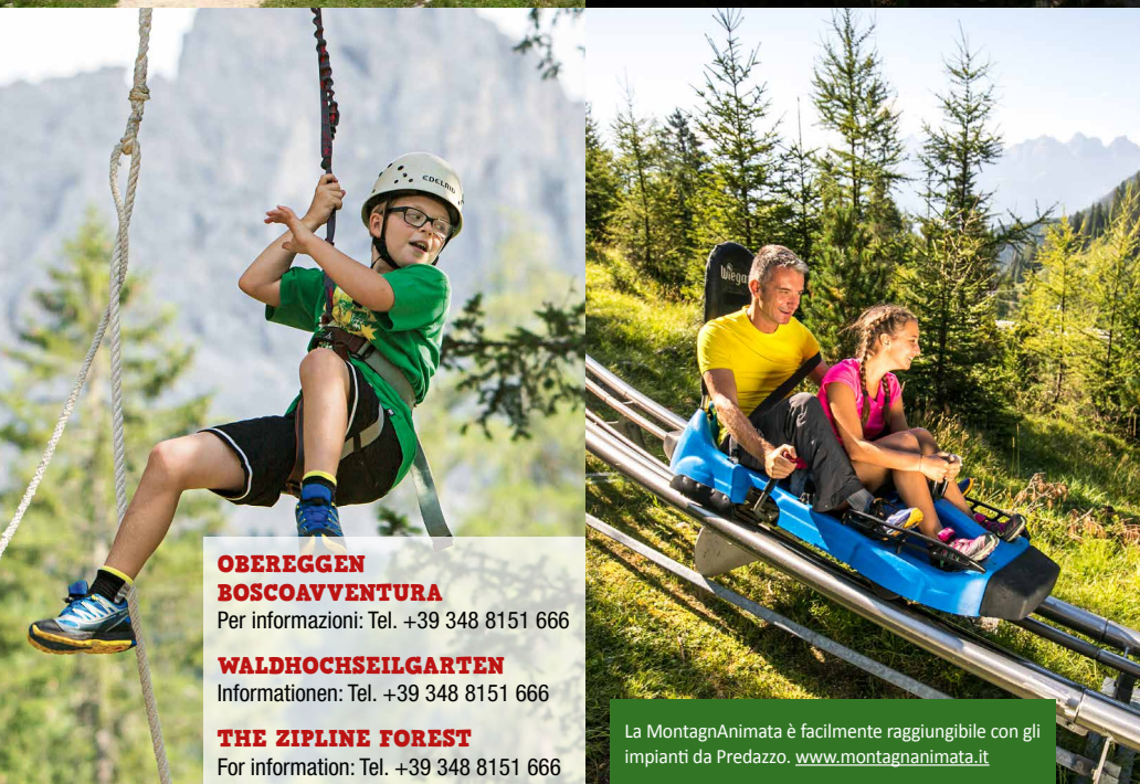
OBERECCEN BOSCOAVVENTURA Per informazioni: Tel. +39 348 8151 666 WALDHOCHSEILGARTEN Informationen: Tel. +39 348 8151 666 THE ZIPLINE FOREST For information: Tel. +39 348 8151 666

La MontagnAnimata è facilmente raggiungibile con gli impianti da Predazzo. www.montagnanimata.it